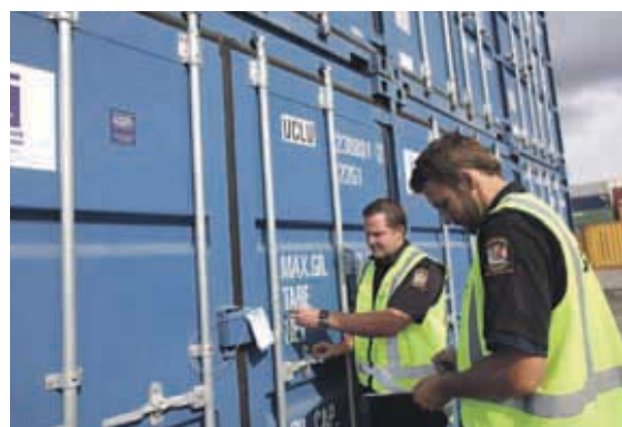
El informe propone optimizar la vigilancia aduanera / IPM

Según el informe, esta "barrera" a nuestras exportaciones sería una excepción, ya que advierte de que la UE se está quedando atrás en los estándares internacionales, con unos umbrales de minimis muy por debajo de otros mercados de referencia. Así, por ejemplo, señala que Australia sitúa este límite en 700 euros, Estados Unidos en 177 y Japón fija un máximo de 75 euros para ahorrar trámites aduaneros a los productos importados. "Europa debe alinearse con las prácticas de los demás bloques comerciales internacionales", considera el documento de la patronal europea. ■■