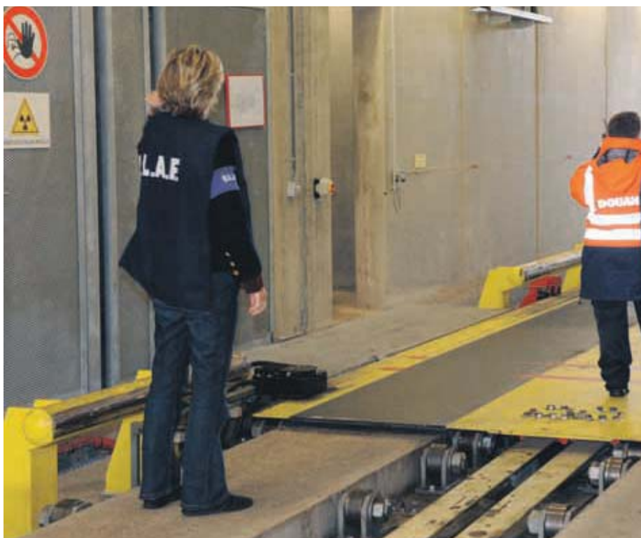
Las empresas de paquetería observan importantes ahorros en la reforma aduanera que propone su patronal